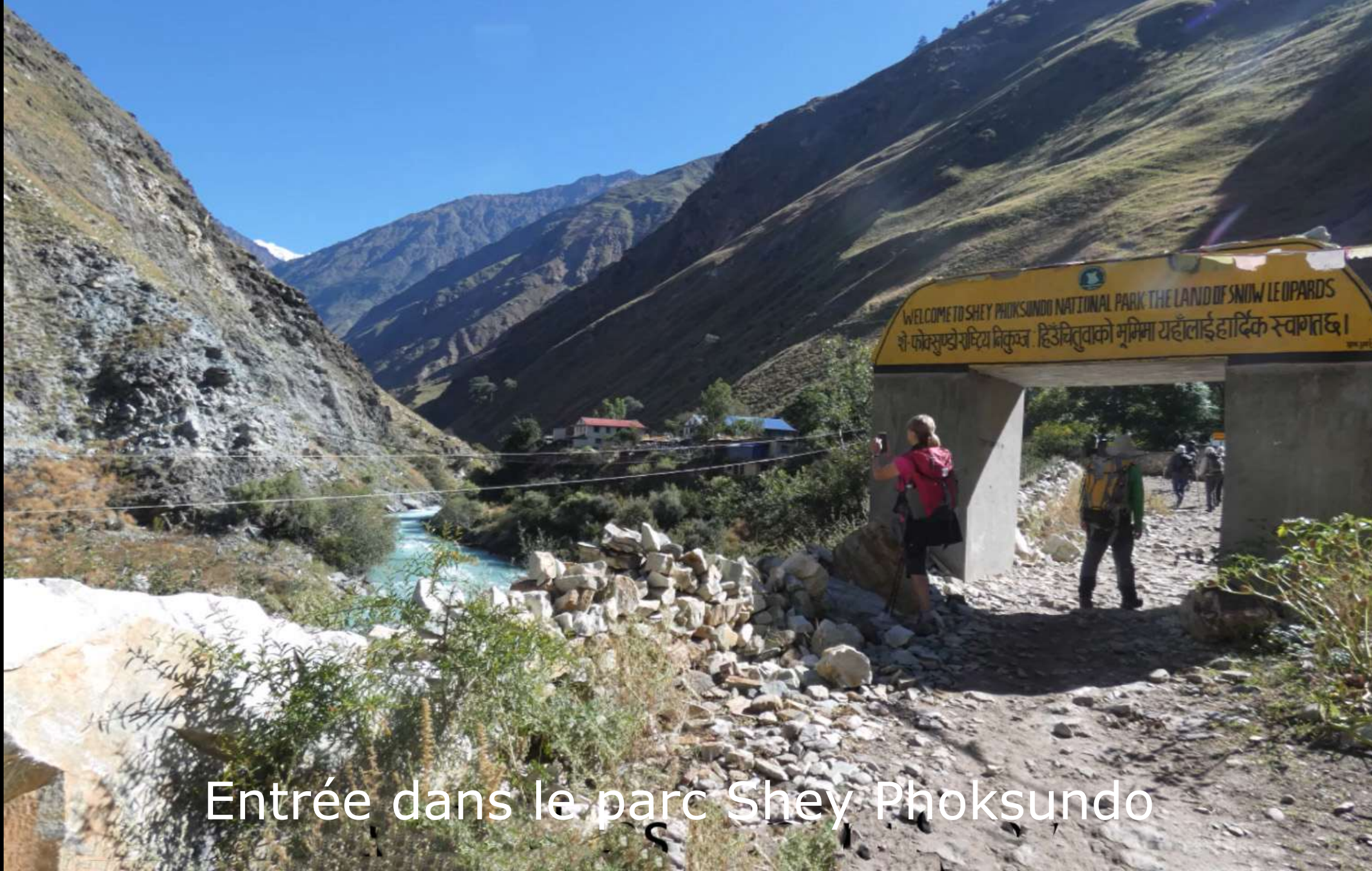
Entrée dans le parc Shey Phoksundo