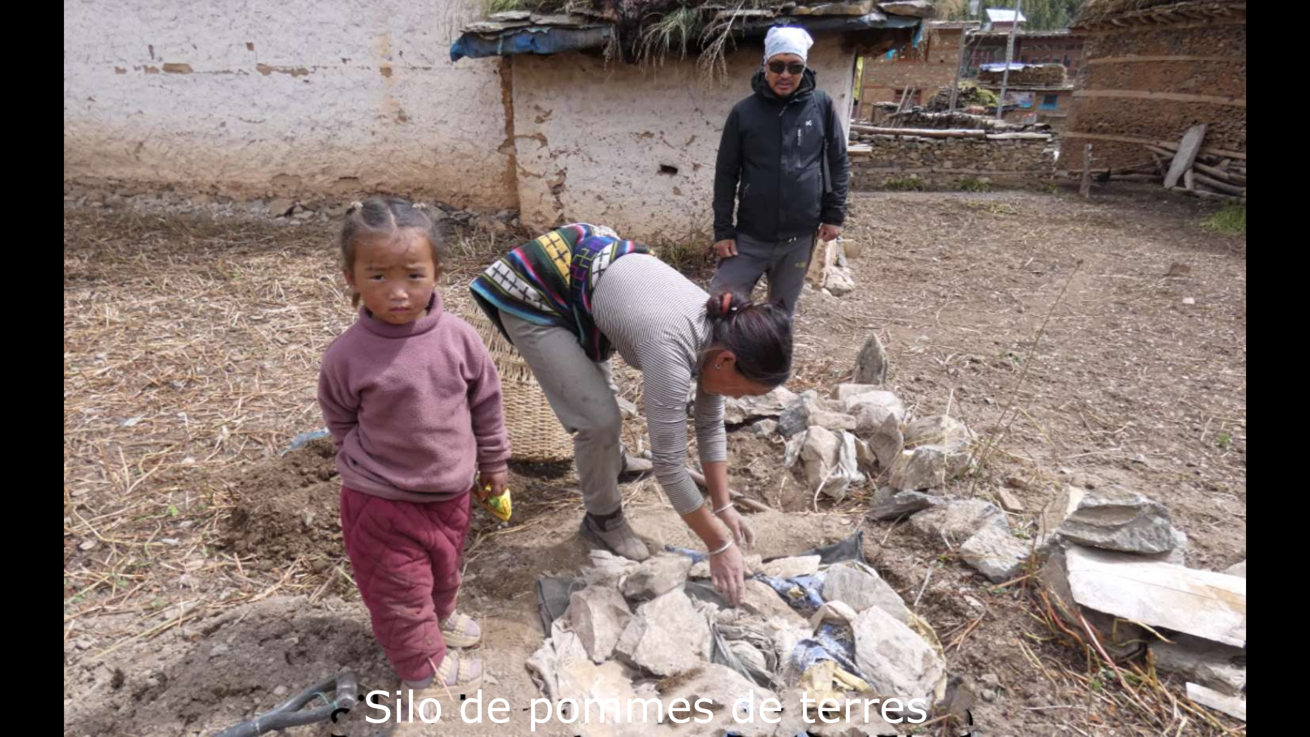
Silo de pommes de terres