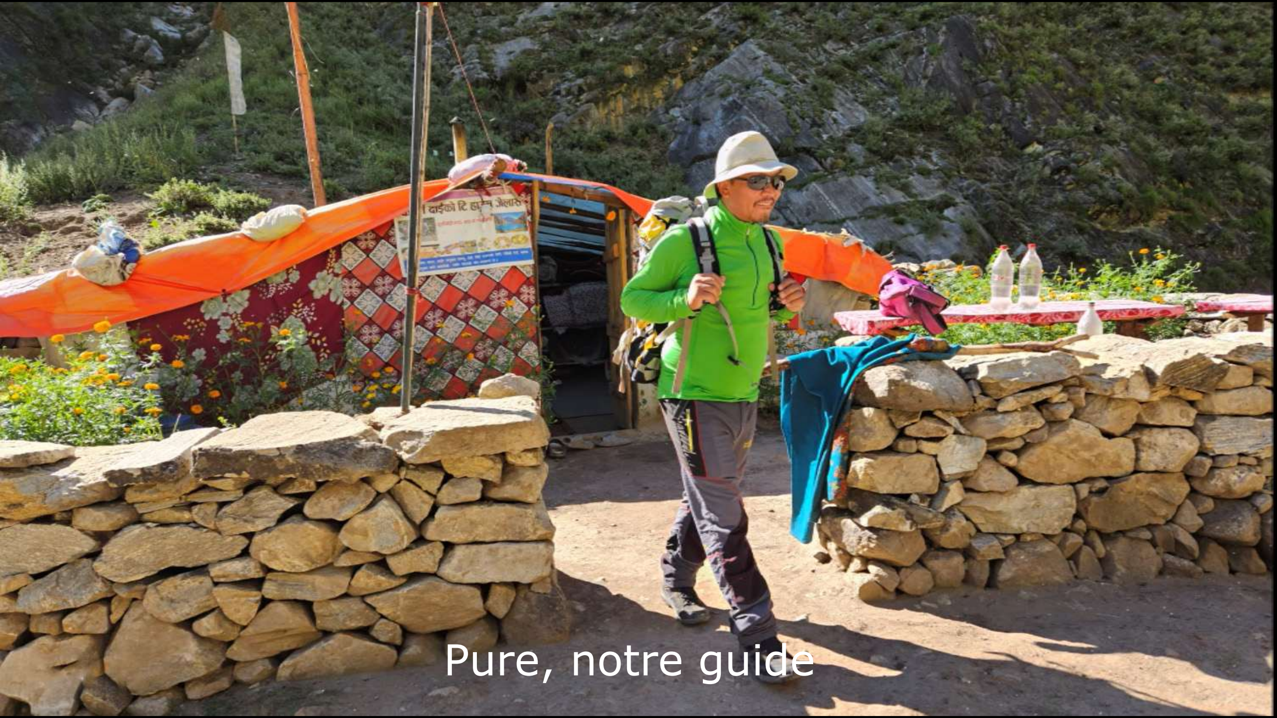
Pure, notre guide