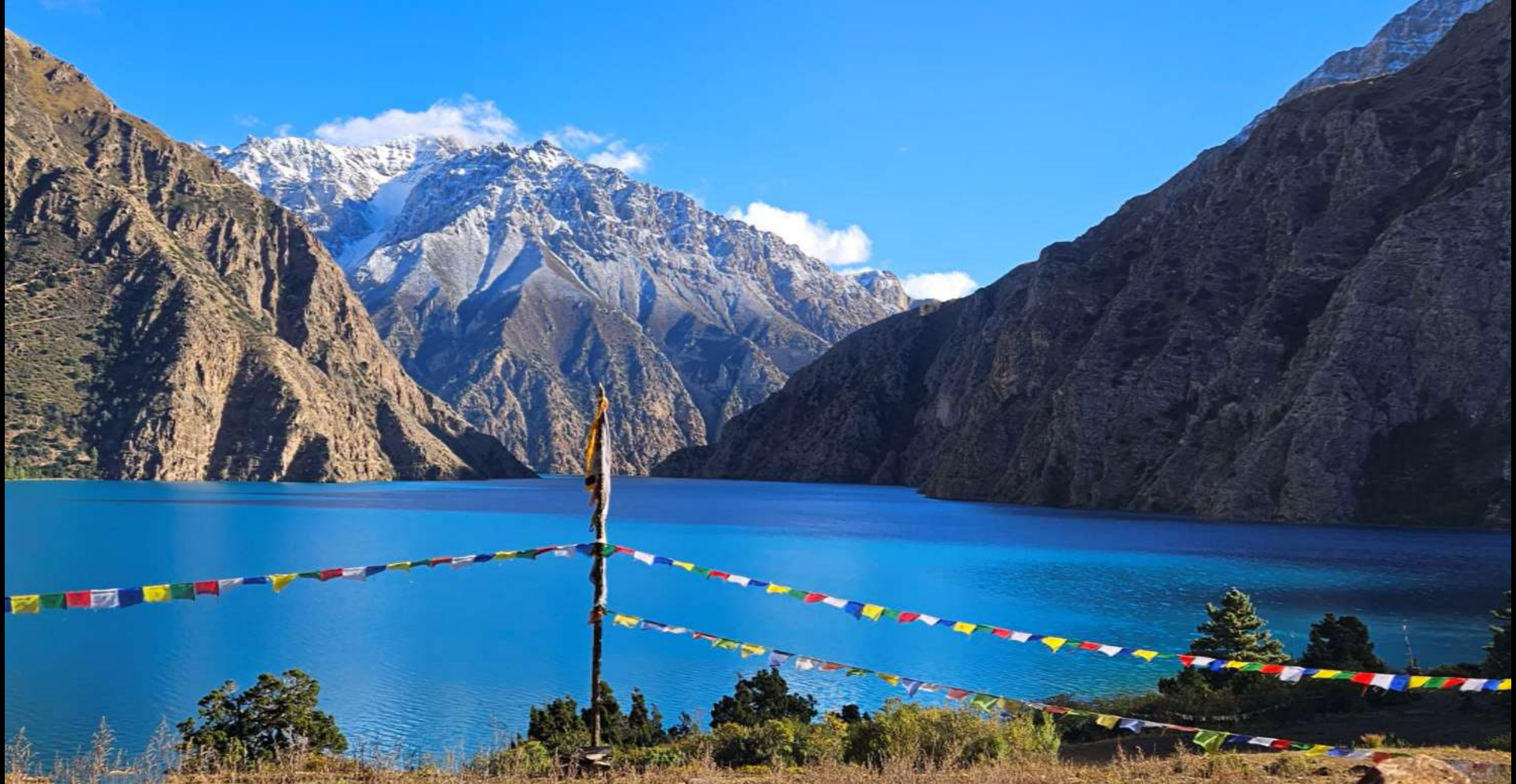
Balade autour du lac